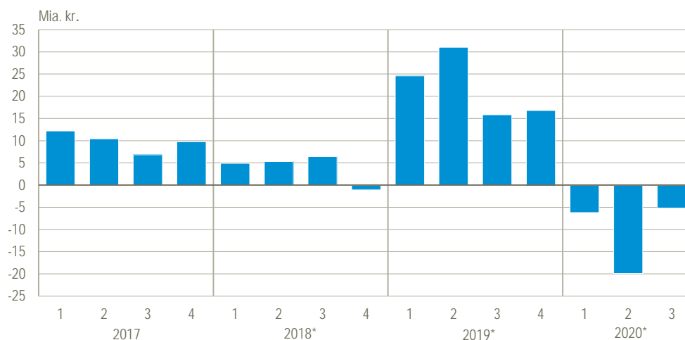
Figur 2. Den offentlige saldo (fordringserhvervelsen, netto)