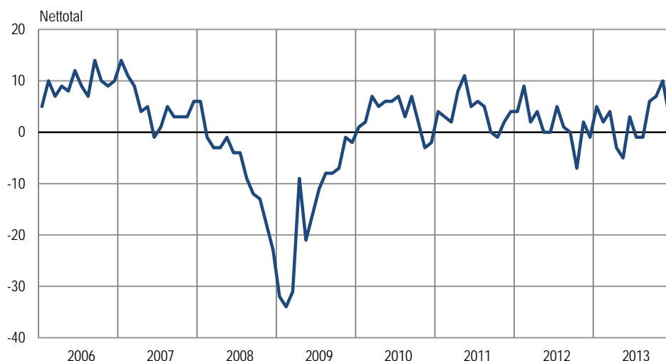
Sammensat konjunkturindikator for industri, sæsonkorrigeret

Anm.: Den sammensatte konjunkturindikator er en sammenvæjning af forventet produktion, vurderet ordrebeholdning og vurderede færdigvarelagre.