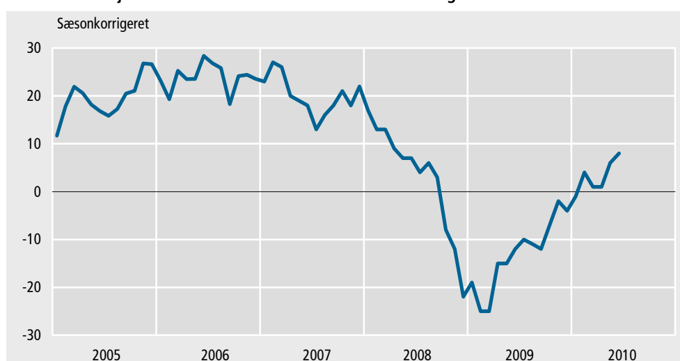
Sammensat konjunkturindikator for serviceerhverv. Forventninger til de kommende tre måneder

Serviceerhvervenes forventninger til de kommende tre måneder er steget en smule i forhold til seneste måned, når der ses bort fra sæsonudsving. Den sammensatte konjunkturindikator er 8 i juni, mens den i maj var 6. Til sammenligning var den sammensatte konjunkturindikator -12 for et år siden. Indikatoren er en sammenvejning af serviceerhvervenes forventninger til beskæftigelse og omsætning de kommende tre måneder.